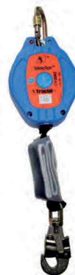
BLOCFOR™ 5/6 ESD M47-10

Connettore girevole M47 standard all'estremità dell'ammortizzatore